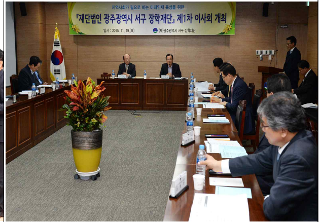
(재)광주광역시서구장학재단 제1차 이사회