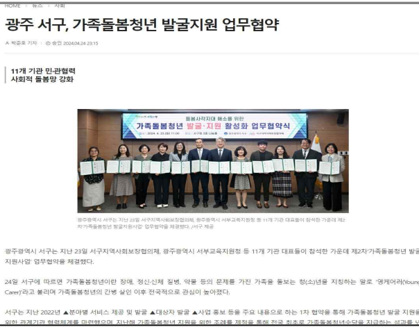
가족돌봄청년 발굴·지원 업무협약식(24. 4. 23.)