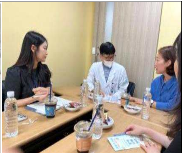
협약병원(광주한국병원) 방문 간담회 실시