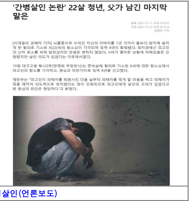
가족돌봄청년 간병살인(언론 보도)