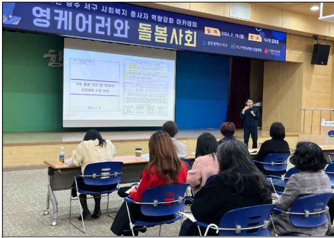
인식변화를 위한 사회복지종사자 교육(24. 2. 19.)