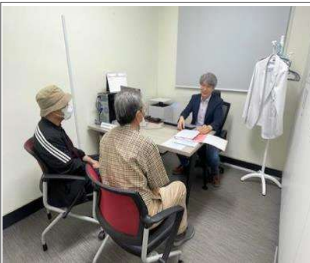
협약병원(무지개병원) 협력의사 진료 사진